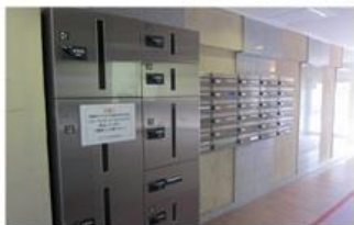
エントランス・宅配ボックス